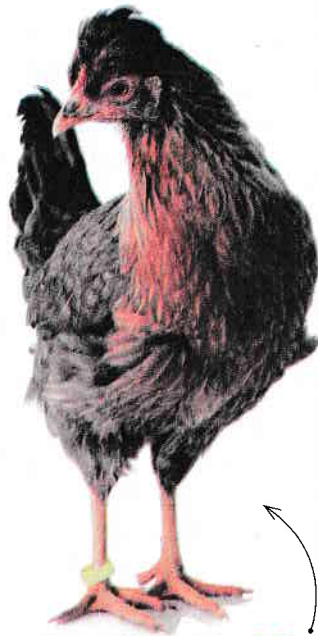
Cântărește între 2 și 2,7 kg