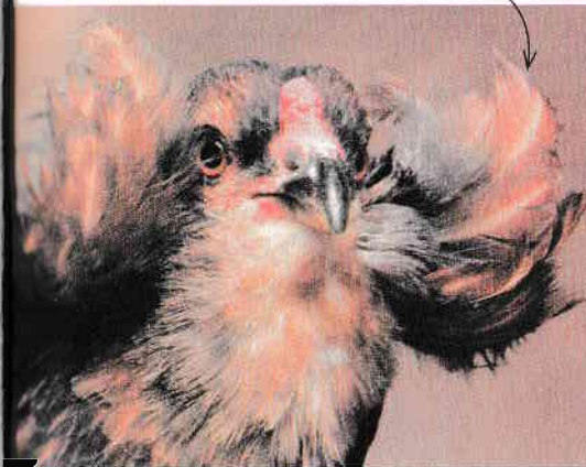
Pene magnifice la urechi